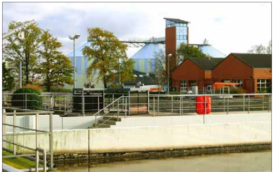
Die Kläranlage in Watenbüttel ist das Herzstück der Stadtentwässerung Braunschweigs.

Veolia sieht trotz dieses hohen Preises noch hinreichende Gewinnmöglichkeiten. Die Frage ist, warum die Stadt nicht genauso