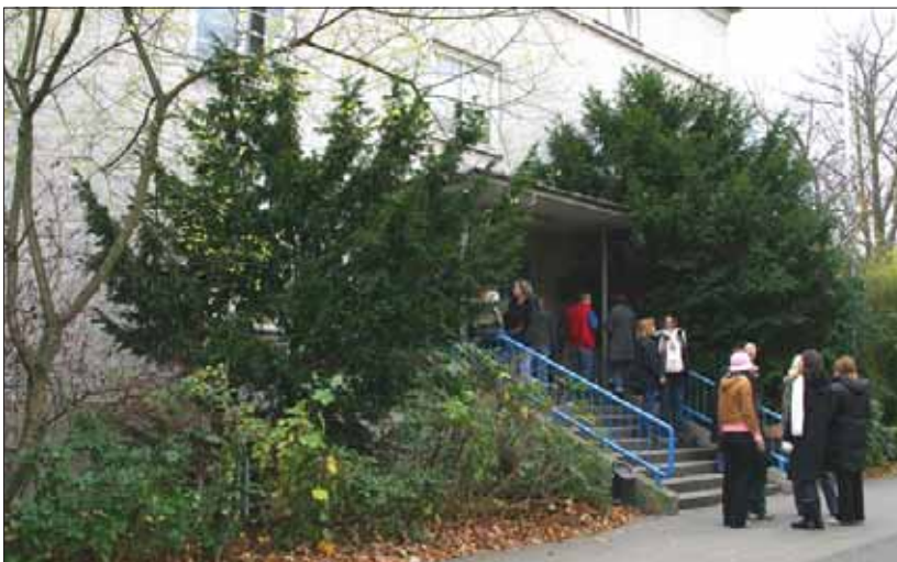
■ 1 300 Studentinnen und Studenten und zahlreiche Arbeitsplätze gibt es an der Fachhochschule an der Ludwig-Winter-Straße. Sie müssen für Braunschweig erhalten bleiben!

Vor diesem Hintergrund bleibt ein sehr bitterer Beigeschmack bei der Einrichtung der Kunststiftung. Es ist zu hoffen, dass Stadtverwaltung und Ratsmehrheit doch noch das gleiche ideelle und finanzielle Engagement auch für den Erhalt der Fachhochschule aufwenden.