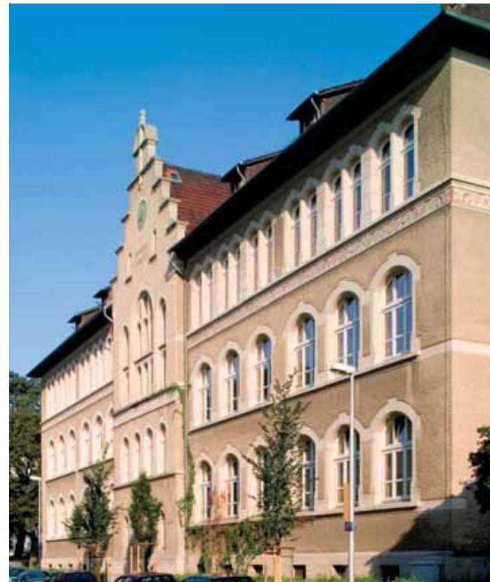
Trotz hervorragenden Konzepts keine Ganztagschule: die Grundschule Comeniusstraße im östlichen Ringgebiet.

Wenn man diesen Versprechungen Glauben schenkt, so wird es in Braunschweig bald auf jeden Fall einige Ganztagsgrundschulen geben – vier, wenn Dr. Hoff-