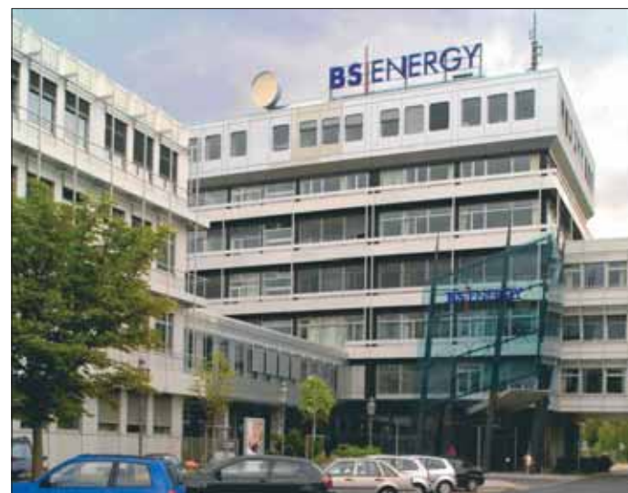
Die Braunschweiger Versorgungs-AG: ehemals sprudelnde Geldquelle für Braunschweig.

kauf der Braunschweiger Versorgungs-AG entgehen der Stadt Einnahmen von über 30 Millionen Euro im Jahr durch entgangene Gewinnbeteiligungen – erheblich mehr, als die Stadt durch Schuldentilgung an Zinsen einspart. Ist das eine erfolgreiche Haushaltssanierung?