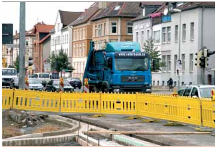
Braunschweiger Vielfalt der unangenehmen Art: Eine der unzähligen schlecht koordinierten Baustellen – Ärgernis für alle Verkehrsteilnehmer und Anwohner.

Und dann teilt er der erstaunten Öffentlichkeit mit, dass er selbst eine Konferenz einberufen habe, weil Fachbereichsleitung und