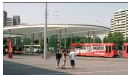
Regionalverkehrsbahnhof Braunschweig

So kurz vor der Kommunalwahl hatte das erhebliche Auswirkungen: Zunächst wurde unter Federführung der Braunschweiger Verkehrs-AG auf die Schnelle eine öffentliche Informationsveranstaltung angesetzt, in der die geplanten Änderungen vorgestellt wurden. Diese Veranstaltung war sehr gut besucht, und die Teilneh-