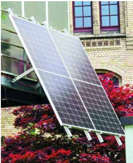
Ein Solapanel passt an (fast) jeden Balkon

■ Das geht natürlich nicht! Die Klimaerwärmung und das Artensterben haben ein solches Maß erreicht, dass ein grundlegender Wandel unserer Lebensweise erforderlich ist, um unseren Planeten lebenswert zu erhalten. Dafür ist die Politik gefordert. Sie muss die Rahmenbedingungen schaffen. Aber neben den dringend notwendigen Aktivitäten der Politik gibt es viele Schritte, die jeder von uns tun kann, um dem Klima und der Umwelt ein Stück zu helfen. Wir haben daher in unseren letzten Ausgaben (Sie finden sie unter https://www.spd-braunschweig.de/ortsvereine/ortsverein-oestliches-ringgebiet/ ) eine Reihe begonnen, in der wir jeweils Anregungen für ein umweltbewusstes Verhalten zusammentragen.