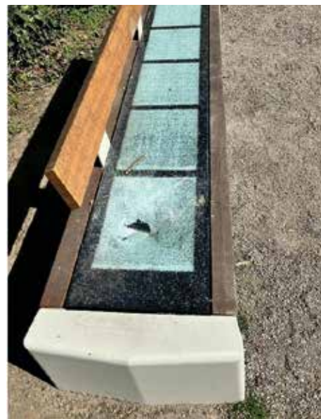
Zerstörte Solarbank im Park an der Hochstraße

liegt es oft nicht an dem mangelnden Willen von Politik und Verwaltung, etwas zu gestalten, sondern schlichtweg daran, dass gegen die blinde Aggression und Zerstörungswut von einigen Menschen leider kein Kraut gewachsen ist.