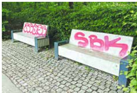
Beschmierte Bänke an der Rollschuhbahn im Jahr 2024

Nur wenige Wochen nach Inbetriebnahme wurde der Platz verwüstet, das Glas der Solarbank wurde zerschlagen und komplett zerstört. Wie man auf die Idee kommt, etwas mit brachialer Gewalt zu zerstören, was anderen Freude macht, wird mir für immer ein Rätsel bleiben. Fakt ist auf jeden Fall: Wenn einige mit hohem Aufwand geplante und beschaffte Einrichtungen in unserem Stadtteil mit der Zeit wieder verschwinden, dann