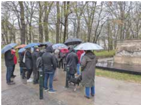
Trotz Regen, viele Besucher am Kolonialdenkmal

Den Abschluss bildete ein gemeinsames Beisammensein im Anton's Café. Dort gab ein Mitarbeiter der Basketball Löwen interessante Einblicke in die Jugendarbeit des Vereins. Bei kosten-