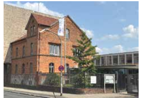
TAB – der Verwaltungsbereich - älter als 100 Jahre

Durch die Integration aktueller Themen in den Unterricht werden konti-