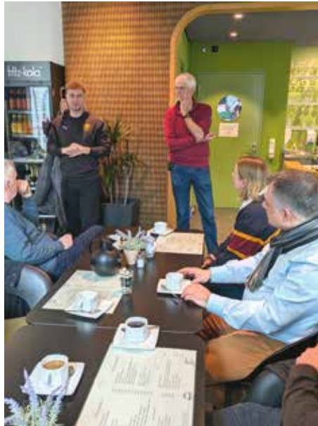
Regener Austausch bei Kaffee und Kuchen im Café Anton's im Herzog-Anton-Ulrich-Museum